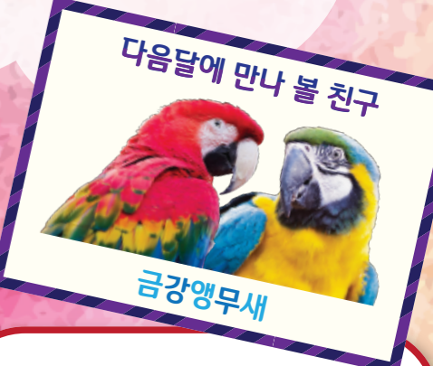
다음달에 만나 볼 친구 금강앵무새